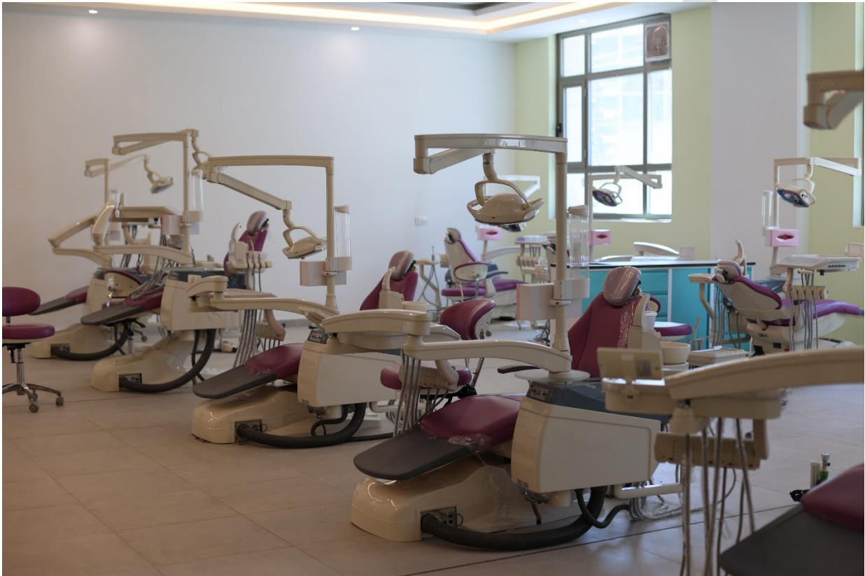
(عيادات طب الاسنان في جامعة اشور)