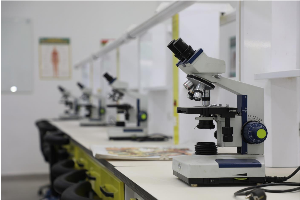
(المختبرات التعليمية في جامعة اشور)